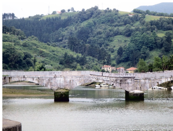
Figura 4. Estado del puente de Deba tras el asiento de la pila en julio de 2018.

El puente presenta una fábrica de piedra caliza de gran calidad, siendo el ejemplo más representativo de puentes de piedra del siglo XIX en el territorio Histórico de Guipúzcoa, motivo por el cual goza en la actualidad, de la máxima protección patrimonial [3]. Presenta además la peculiaridad de formar parte del Camino de Santiago en su ruta del Norte que recorre la Cordillera Cantábrica, desde Donostia-San Sebastián (Guipúzcoa – España) hasta Ribadeo (Lugo – España).