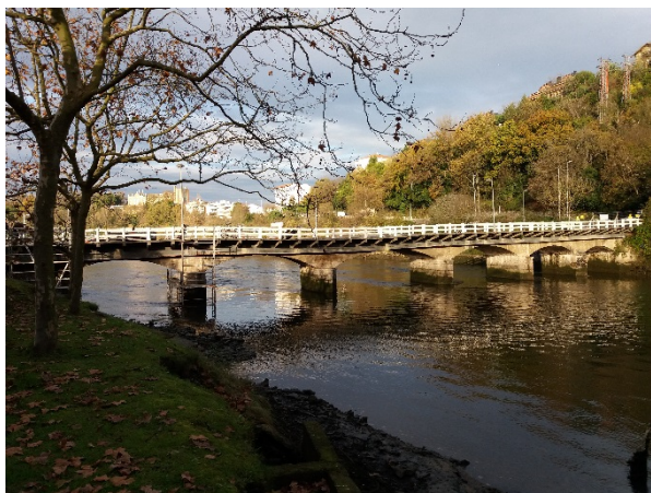
Figura 1. Vista aguas arriba del puente de Astiñene, San Sebastián, Guipúzcoa (España).

En agosto de 2017, técnicos municipales del Ayuntamiento de San Sebastián detectaron en el puente de Astiñene, un descenso en la alineación del tablero, especialmente importante en su pila 3, que se acompañaba de una evidente e importante fisuración del aglomerado en los vanos y pilas adyacentes. Las inspecciones llevadas a cabo en días posteriores pusieron de manifiesto la gravedad de los daños, y el riesgo para la seguridad del tráfico. Considerándose en consecuencia necesario, el cierre provisional de la estructura en tanto se definía un proyecto de emergencia para su reparación y refuerzo.