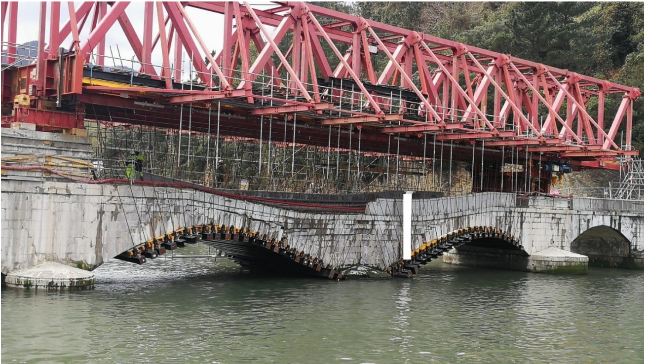
Figura 7. Vista aguas abajo del puente de Deba tras la finalización de los trabajos de la fase 1.