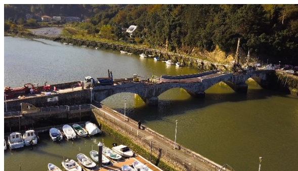
Figura 2. Vista desde aguas abajo del puente de Deba, iniciados los trabajos de reparación. Se aprecia claramente el descenso de la pila, y la pérdida de la rasante.

en cantidad como en severidad. Las inspecciones y análisis realizados pusieron de manifiesto lo que era claramente evidente para un espectador avezado, esto es, la fragilidad de la estabilidad estructural y el riesgo patente de que la ruina se produjera en cualquier momento. Como en el caso anterior, el riesgo para la seguridad de los usuarios de la estructura aconsejó el inmediato cierre provisional de la estructura y la realización de un proyecto de emergencia de reparación y refuerzo.