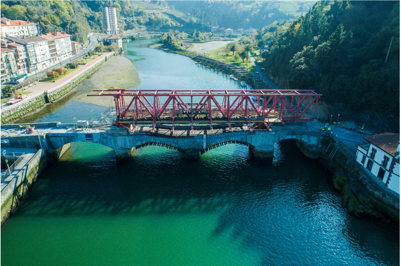
Figura 8. Vista desde aguas abajo del puente de Deba con los trabajos de la primera fase prácticamente terminados.