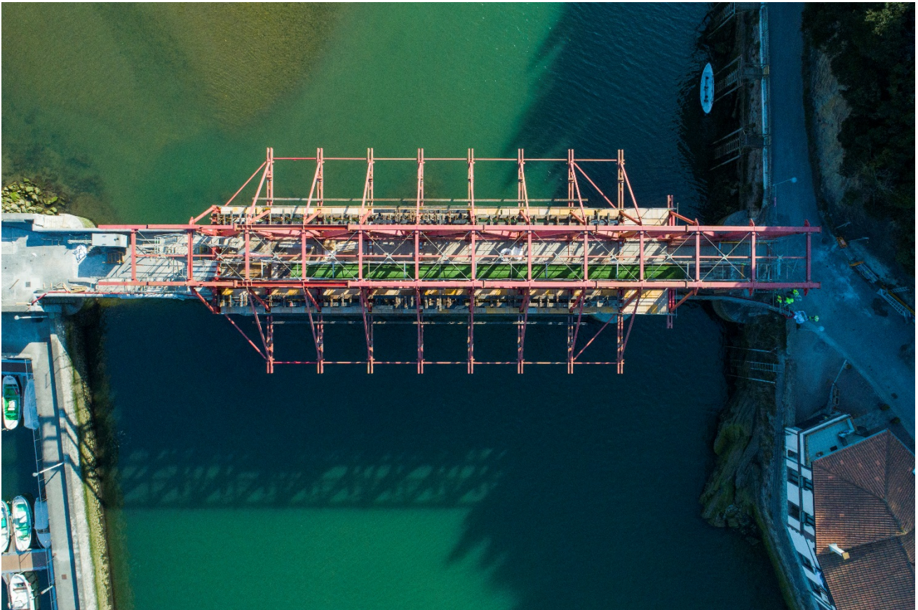
Figura 6. Vista cenital del puente de Deba con los trabajos de la primera fase prácticamente terminados.

En este sentido es importante recalcar que las labores de inspección, auscultación y de mantenimiento son actividades a tener en cuenta en la vida útil de cualquier estructura con el fin de alargar al máximo su durabilidad.